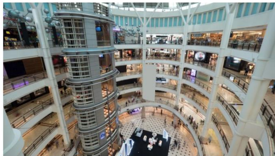
Centrum handlowe (zdj. ilustracyjne)

Listopadowy lockdown przyniósł gospodarce ok. 8 mld zł strat z handlu – podały Polska Rada Centrów Handlowych i Związek Polskich Pracodawców Handlu i Usług. Organizacje poinformowały, że pierwszego dnia po ponownym otwarciu w sklepach pojawiło się ok. 30 proc. klientów mniej niż rok temu w tym samym czasie