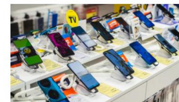
Sklepy ze sprzętem RTV i AGD znajdujące się w centrach handlowych zostały zamknięte po raz trzeci w 2020 roku.

Od 28 grudnia, zaczęły na nową obowiązywać ograniczenia dotyczące funkcjonowania galerii handlowych. Zdziwienie może budzić klucz doboru poszczególnych segmentów handlu, bo rząd od dawna mówi, że chce przykryć śrubę zagranicznym sieciom handlowym (stąd m.in. podatek handlowy, który wchodzi od stycznia). Tymczasem po kolejnym lockdownie można w galeriach kupić materiały budowlane i meble, gdzie najsilniejsze są firmy z kapitałem zagranicznym, ale elektroniki i sprzętu gospodarstwa domowego, gdzie 85 proc. to podmioty rodzime, już nie. Jedną z ofiar nowych przepisów są sklepy sprzedające sprzęt IT, RTV i AGD. Okazuje się, że brak konsekwencji przepisów sprawi, że sklepy specjalistyczne w galeriach nie będą mogły działać, ale np. hipermarkety nadal będą mogły taki sprzęt sprzedawać. Eksperci wskazują, że rządowe przepisy zachwiał konkurencją w branży i budzą zaniepokojenie przedsiębiorców.