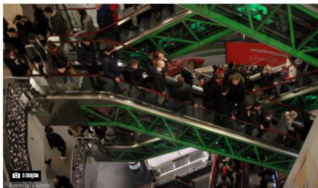
Tłumy na świątecznych zakupach w Złotych Tarasach. 16 grudnia 2017 r. (PRZEMEK WIERZCHOWSKI)

Od 28 grudnia galerie handlowe znów będą zamknięte. - Zwykle wtedy ruch jest większy. Ludzie robią zakupy spożywcze, sprzedaje się moda, ludzie chodzą do fryzjerów, kosmetyczek - mówi ekspertka od handlu.