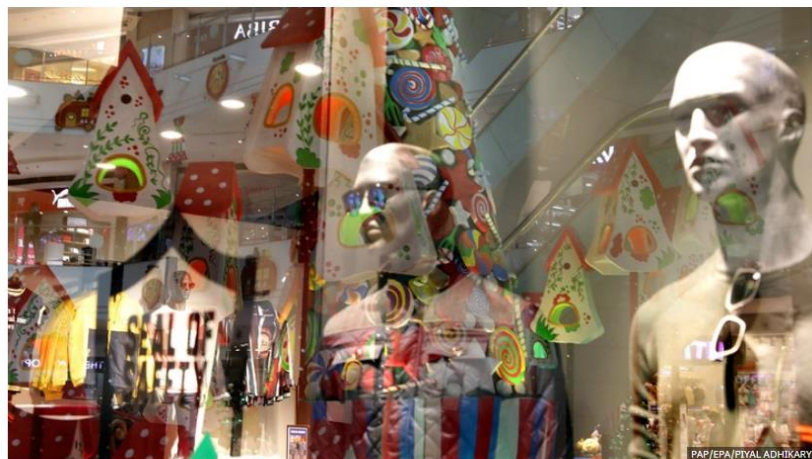
Galerie handlowe pozostaną zamknięte do 17 stycznia